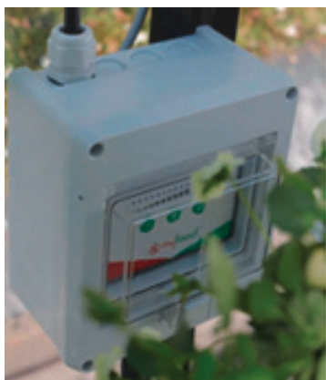
Un boîtier intelligent installé dans une serre