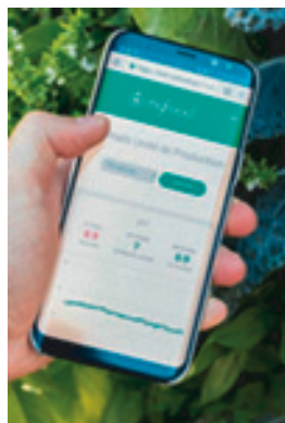
L'application Myfoodhub connectée au boîtier intelligent

Le boîtier intelligent collecte les paramètres utiles au contrôle de la serre : l'acidité, la température de l'eau tout comme la géolocalisation de la serre. Ces données sont stockées dans l'informatique en nuage ( cloud computing ) afin d'être accessibles à l'équipe d'agronomes qui assure un suivi précis de tous les « Pionniers ». Elles alimentent un outil d'intelligence artificielle dont l'objectif est de produire des recommandations pour les « Pionniers » ainsi que d'assurer une surveillance automatisée des serres. Avec le temps, les préconisations s'affinent et permettent une meilleure utilisation des serres au quotidien.